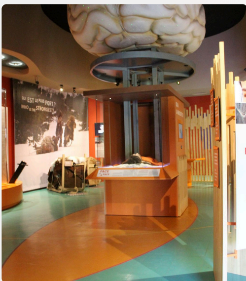
Salle « Morphologie » avant travaux

Dans cet espace d'immersion sensoriel, l'imaginaire et les sens des visiteurs sont sollicités pour entrer dans l'esprit de Pierrette, rêver avec elle. C'est un temps dédié à la question des rituels, des croyances, pour se projeter dans le mystère d'une nuit passée sous le ciel, à ses côtés.