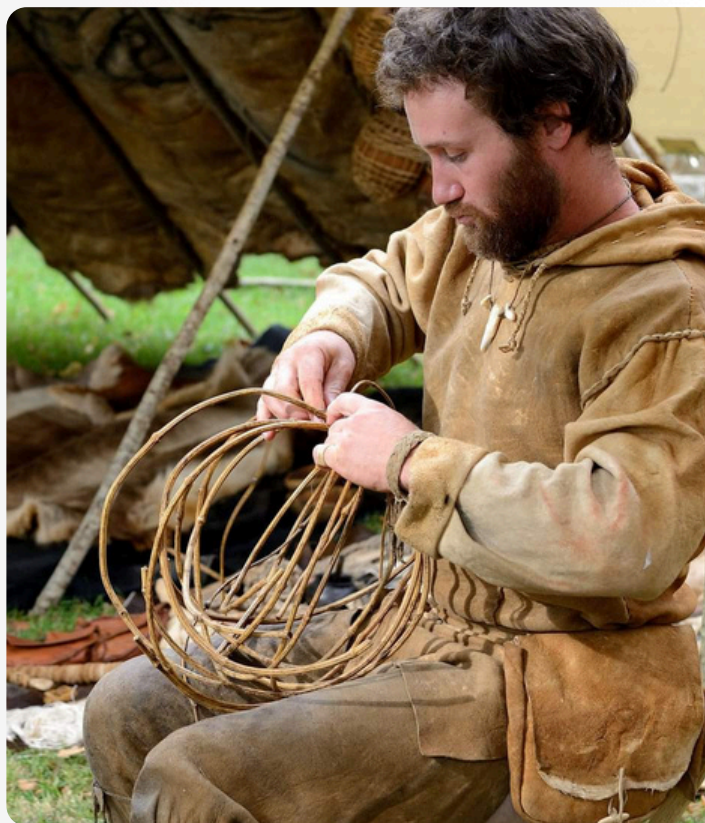
Fabricaton d'un panier par l'association inspiration sauvage

Navigation et nourriture, musique préhistorique, tannage de peaux, poterie ancienne, taille de silex... autant de savoir-faire ancestraux à découvrir au fil des campements installés dans le parc. Costumées et passionnées, les troupes de reconstitution vous feront revivre le quotidien de la Préhistoire à travers des stands interactifs, des démonstrations spectaculaires et des animations inédites. .