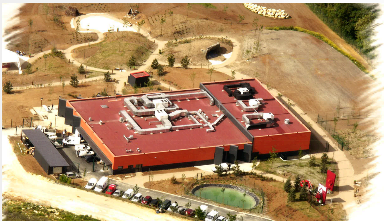
Photo du Paléosite - 2005

Cette rénovation d'envergure s'appuie sur les avancées scientifiques et les découvertes récentes qui enrichissent en permanence la connaissance de nos origines. Une troisième et dernière phase portant sur le parc viendra, en 2027, compléter cette nouvelle saga.