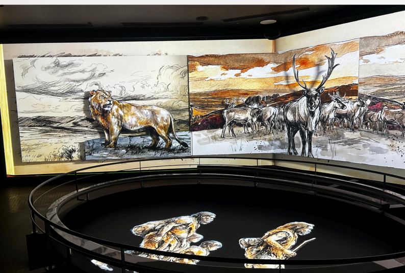
Salle « La découverte de Pierrette »

Le film explore le climat et la faune du Paléolithique, retrace l'évolution des espèces humaines à travers le temps et raconte l'apparition de Néandertal, jusqu'à l'histoire singulière de Pierrette.