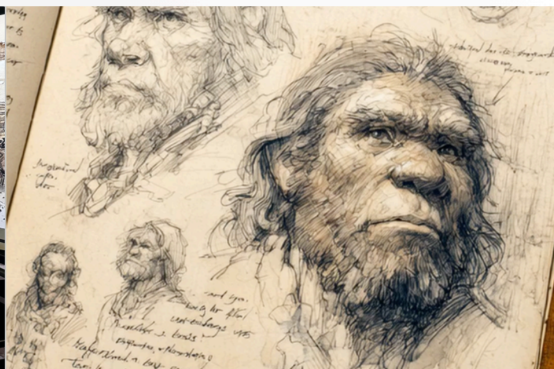
Salle 1 - croquis de Néandertal